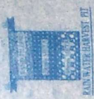
RAIN WATER HARVEST PIT