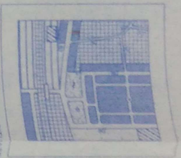
EXTRACT OF MASTER PLAN SITUATED AT STATION ROAD, WARANGAL (DWG. 1) 800'-0" FEET AN INCH SITE UNDER REFERENCE