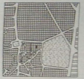
PART EXTRACT OF MASTER PLAN AT RANGASHAIPE WARANGAL. SCALE : 800' TO AN INCH APPLICANT SITE

LICENCED SURVEYOR K. KESHAV MURTHY M.P. 1989