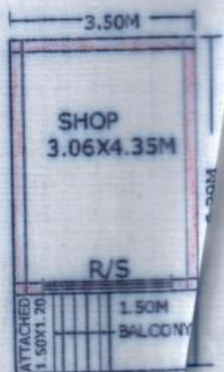
PROP. GROUND FLOOR PLAN

[Signature] COMMISSIONER Municipality, Jangaon