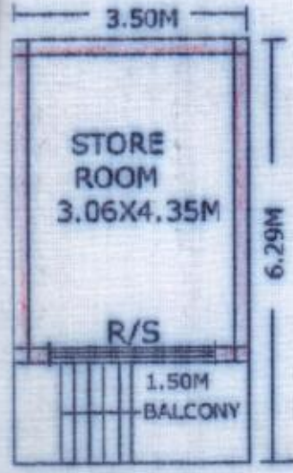
PROP. FIRST FLOOR PLAN