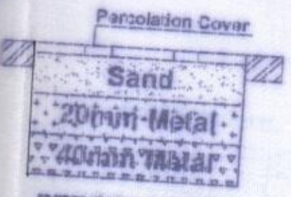
PERCOLATION PIT గమనిక

తరచు అలక వంతునుండి భవన నిర్మాణం అనుమతి పొందిన దానివల్ల దాని పొందిన అనుమతి పొందిన భూమిపై హక్కులను తయారే అభ్యుదయం వల్ల వచ్చే హక్కులు అనుమతి యందులో అప్పటి నిర్మాణం కొరకు అనుమతి వ్యాయంధం అనుమతి.