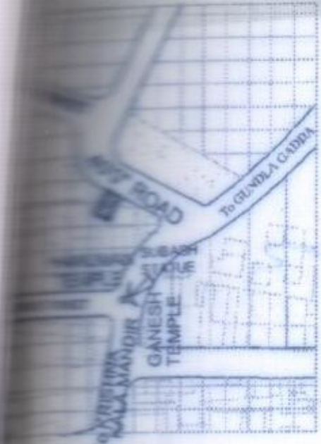
TRACT MASTER PLAN SITE UNDER REFERENCE Scale: 400 = an Inch

Town Planning Officer Jangaon Municipality